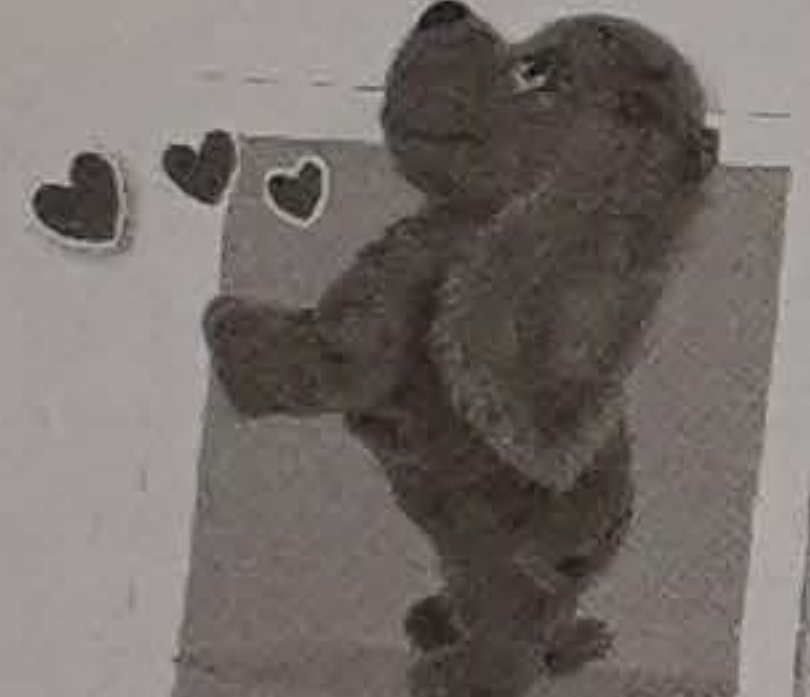
Dă-mi un pupic

Comandă vocală: "BUNĂ!" Descriere: dacă e întinsă pe podea, se va ridica. Dacă e în picioare, va lătra.