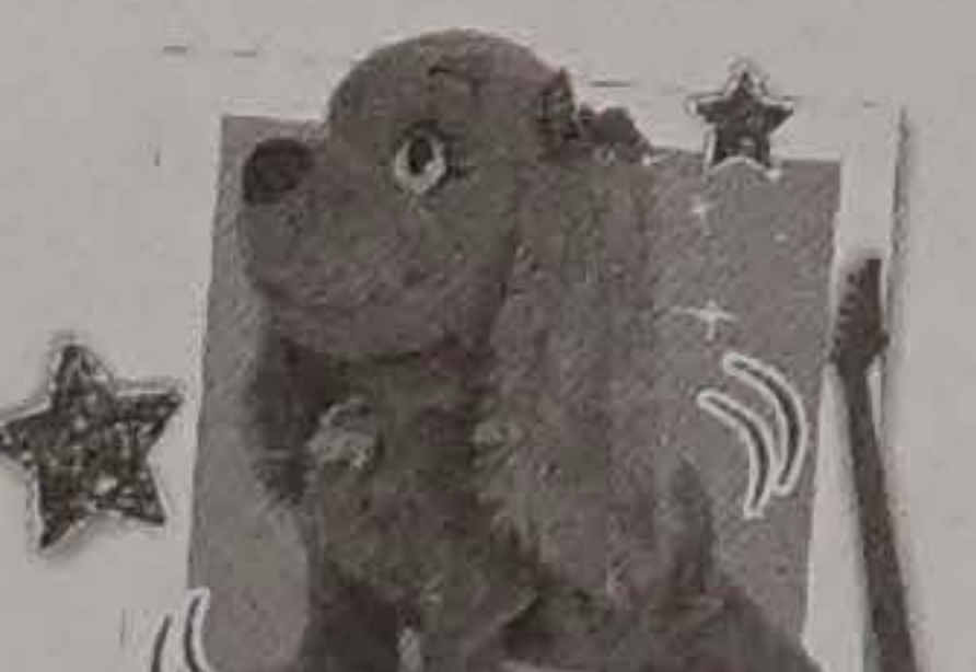
Rock & Roll

Comandă vocală: "SALSA" Descriere: se va auzi muzică salsa, iar Lucy va începe să se miște în ritmul muzicii.