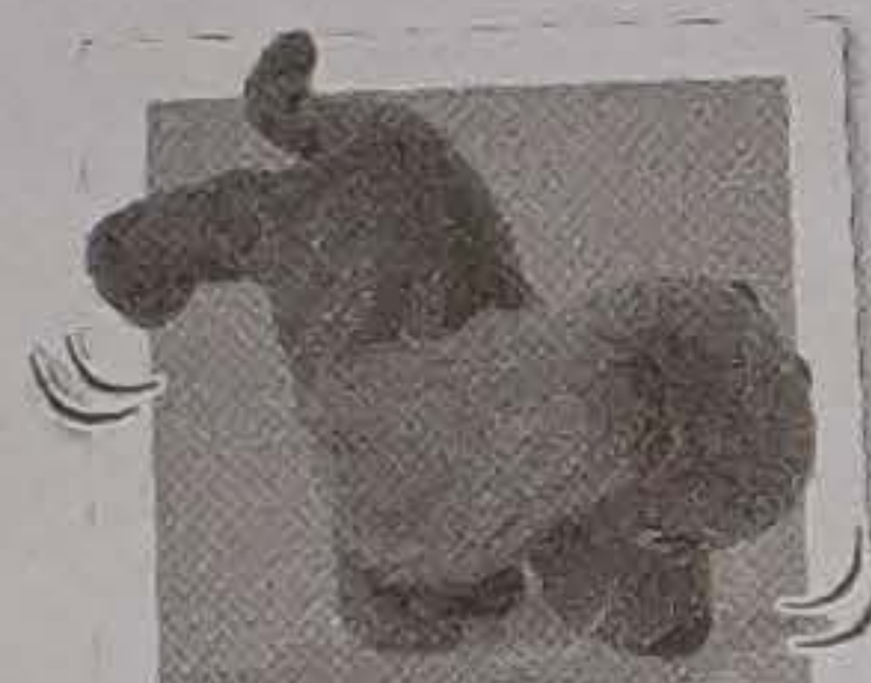
Stai în cap

Comandă vocală: "DĂ-MI UN PUPIC" Descriere: se ridică și sare în față pentru a-ți da un pupic.